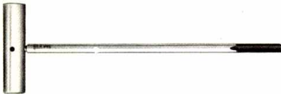
나사부용 청소 공구 (선단탭 형)