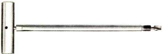
다이어프램, 수지 씰부 청소 공구 (선단드릴 형)